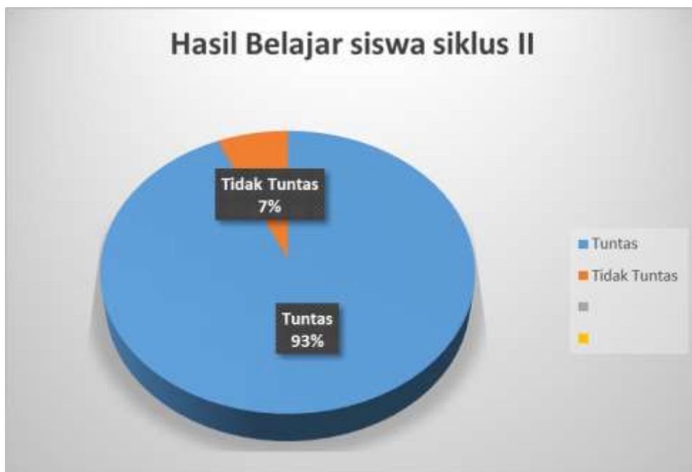
Bagan Persentase Tuntas Belajar Klasikal Siklus II

Tabel menunjukkan nilai rata-rata sebesar 82,38. Berdasarkan data hasil belajar siswa pada tabel, dapat diketahui bahwa 21 siswa tuntas KKM dan hanya 5 siswa yang tidak tuntas KKM. Ketuntasan belajar klasikal siklus II secara visual dapat dilihat pada bagan berikut: