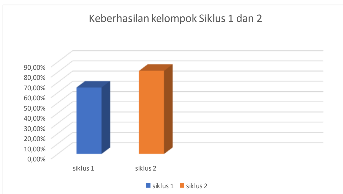
Bagan Peningkatan Aktivitas Belajar Siswa

Aktivitas siswa dikatakan memenuhi kriteria sangat tinggi apabila berada pada rentang persentase 75%-100%, kriteria tinggi apabila berada pada rentang persentase 50%-74,99%, kriteria sedang apabila berada pada rentang persentase 25%-49,99%, dan kriteria rendah apabila berada pada rentang persentase 0%- 24,99%. Tabel menunjukkan rata-rata persentase aktivitas belajar siswa pada siklus II secara keseluruhan mencapai 81,33 %. Berdasarkan hasil pengamatan tersebut dapat disimpulkan bahwa persentase aktivitas belajar siswa dalam model pembelajaran kooperatif tipe STAD termasuk dalam kriteria sangat tinggi dan mencapai indikator keberhasilan yang ditetapkan yaitu 75%. Aktivitas belajar siswa mengalami peningkatan dari siklus I ke siklus II. Peningkatan aktivitas belajar siswa dapat dilihat pada bagan berikut ini: