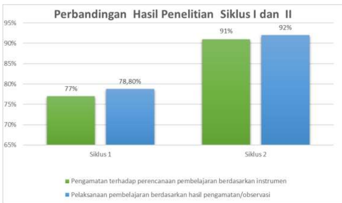
Tabel 4.4 Perbandingan Hasil Penelitian Siklus I dan II

Pada siklus I kemampuan guru dalam pembuatan Modul Ajar dan Pelaksanaan Pembelajaran berdasarkan instrumen berada pada kategori cukup. Setelah penulis dan sebagai Kepala Sekolah melakukan supervise klinis terhadap kesiapan Modul Ajar dan Pelaksanaan Pembelajaran terhadap Guru kelas IV pembelajaran pada siklus II, berada pada kategori baik. Dalam hal ini terdapat kenaikan dalam Perencanaan Pembelajaran /Modul Ajar dari siklus I 77% kategori cukup menjadi 91% dengan kategori sangat baik. Demikian juga terdapat kenaikan dalam pelaksanaan pembelajaran dari 79 % dengan kategori cukup, menjadi 92% dengan kategori sangat baik. Jadi Tindakan supervise klinis dengan melakukan pendampingan terhadap guru dalam membuat modul ajar dan proses Pelaksanaan Pembelajaran yang berpusat pada peserta didik dikatakan berhasil.